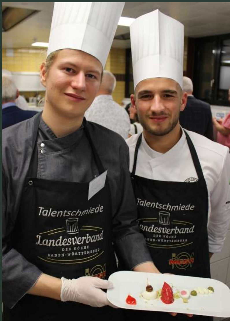
Leines & Till