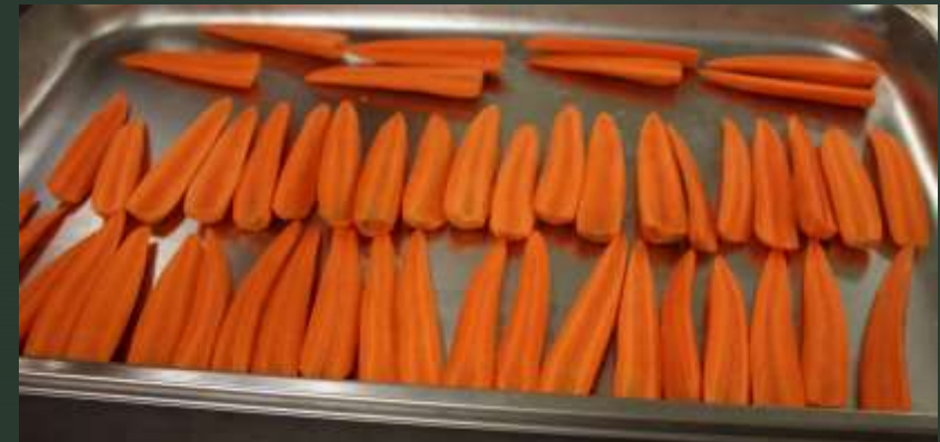
Vorbereitung –gefüllte Karotten