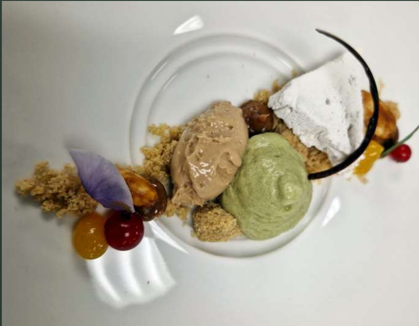
Boden, Grand-Manier-Eissouffle, Nougat-Creme, Passionsfrucht-Gel, Grüne-Tomate-Matcha Espuma, Karamel Eis