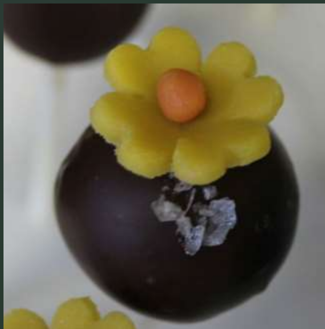
Schokoladen-Schaustück mit Meersalz-Lollies