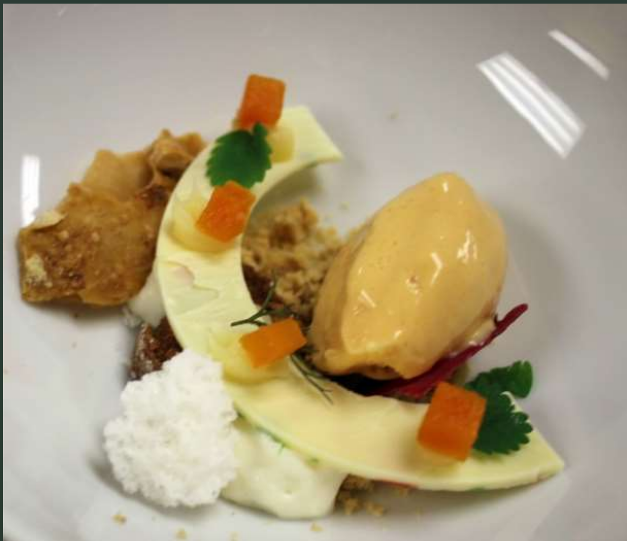
Hokkaido, Hafereis, Haferstreusel, Schokoladenkuchen, Grand-Manier-Creme, Felszucker, Ziegenkäse-Espuma, Gebackener Karamel