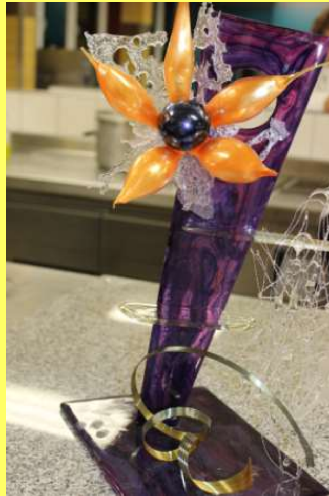
Kollege Dörsam zeigt Zuckerarbeiten