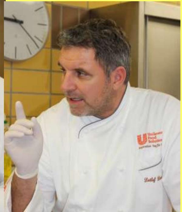
Spezialist für's Süße

Landesberufsschule/Villingen-Schwenningen 16-18.Nov.2012