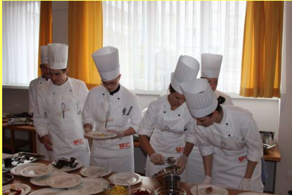
Beim Anrichten von Desserttellern