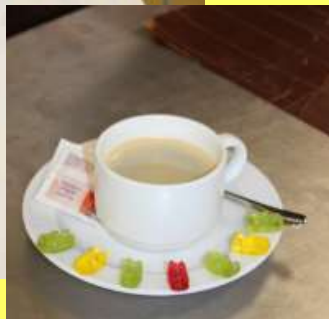
Stärkung für DD