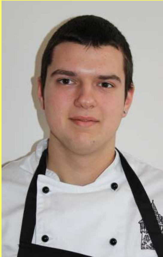
Max Rose Schellenturm, Stuttgart Rudolf Reuter