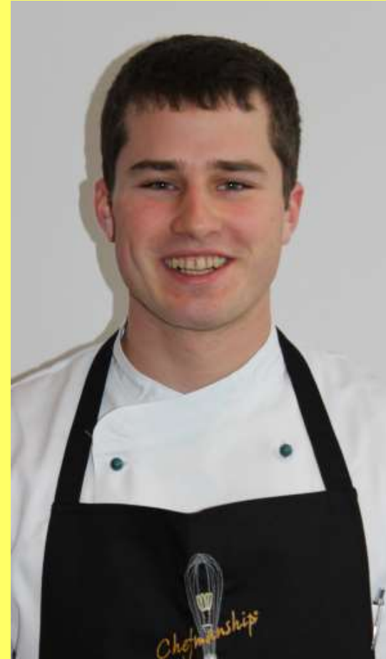
Maximilian Weber Hotel Bareiss, Baiersbronn Oliver Ruthardt