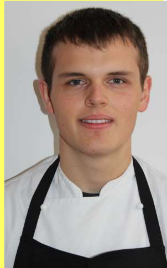
Kai Gebhardt Gasthof Hecht, Ebersbach Bernd Walter