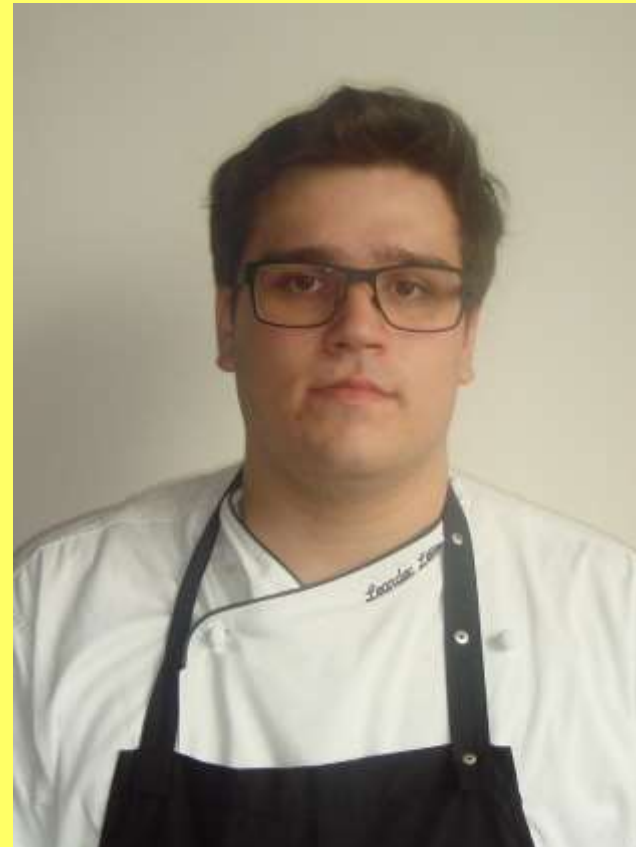
Leander Leins Hotel Staufeneck, Salach Landesberufsschule/Villingen-Schwenningen 11.-13. Nov. 2011