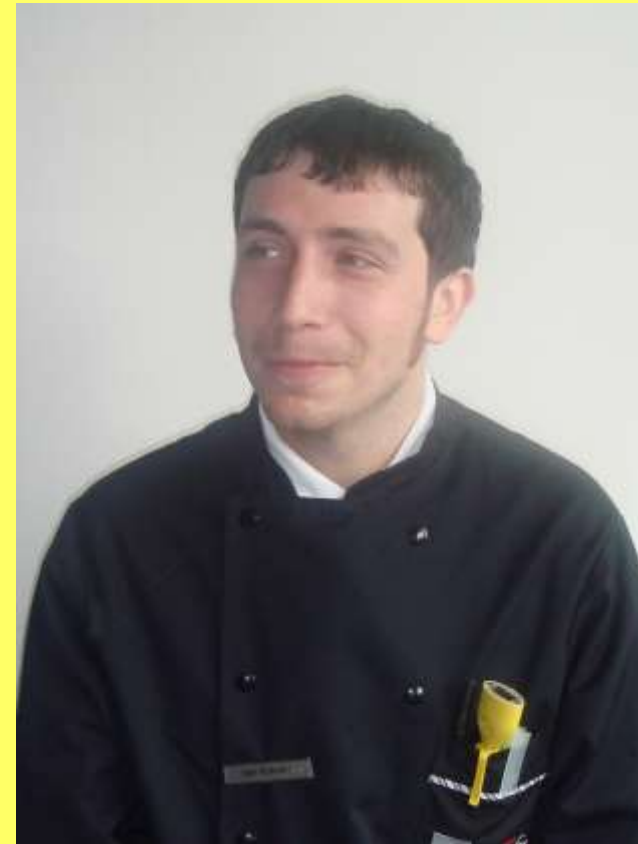
Igor Rybolov Renaissance Hotel, Karlsruhe