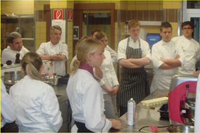
Kuvertürearbeiten eines Nachmittages->