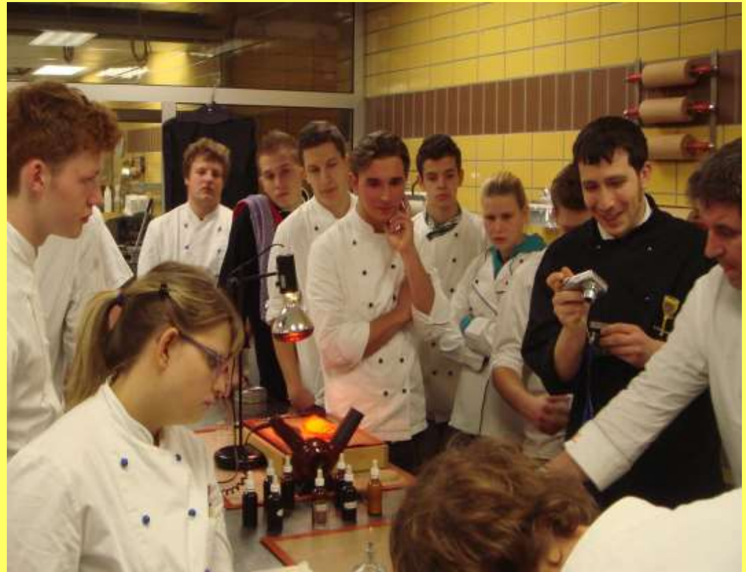
In der Patisserie