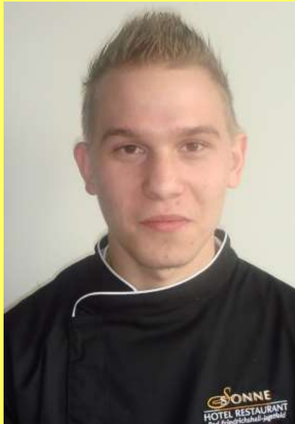
Pascal Grötz Hotel Sonne, Bad Friedrichshall