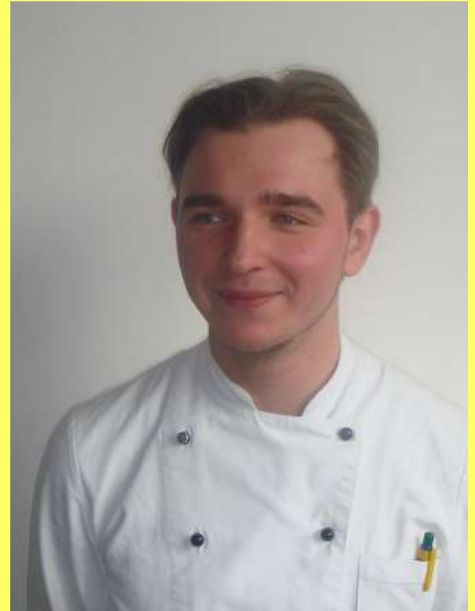
Thomas Kisiolek Löchnerhaus, Reichenau