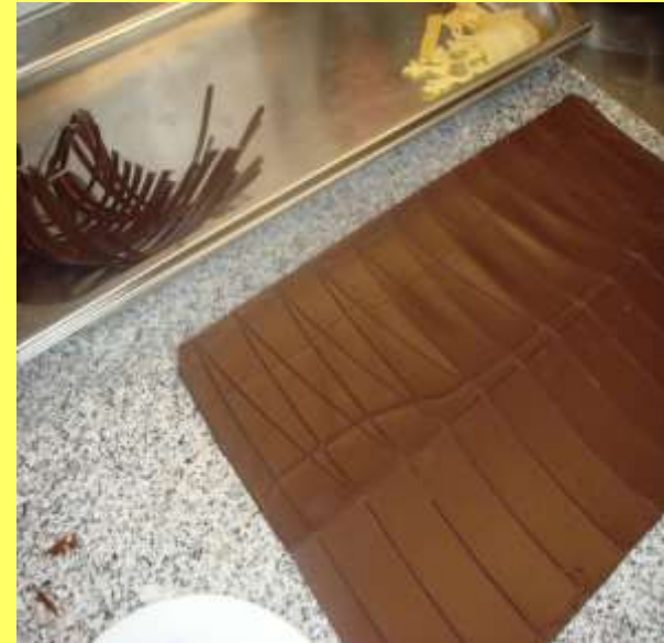
Arbeiten in der Patisserie