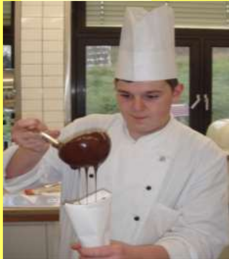
Arbeiten mit Schokolade