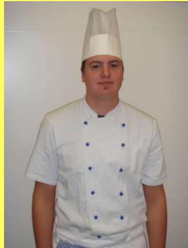
Christopher Hilpert Hotel Bergblick, Bernau