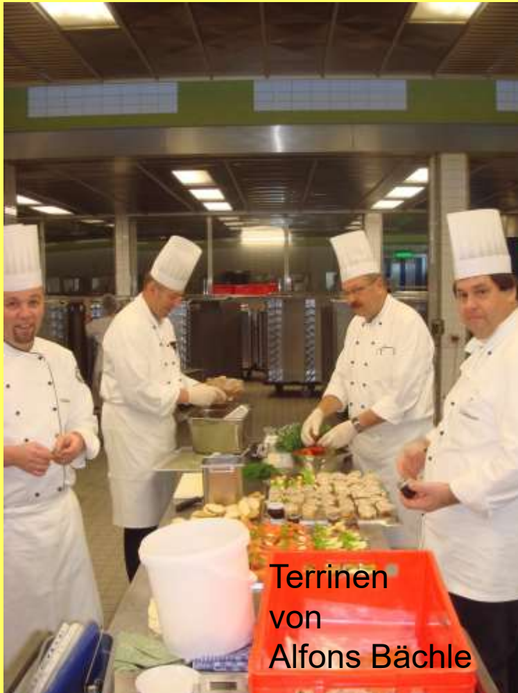
Terrinen von Alfons Bächle